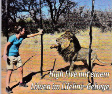
High Five mit einem Löwen im Lifeline-Gehege