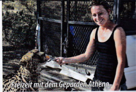
Freizeit mit dem Geparden Athëno