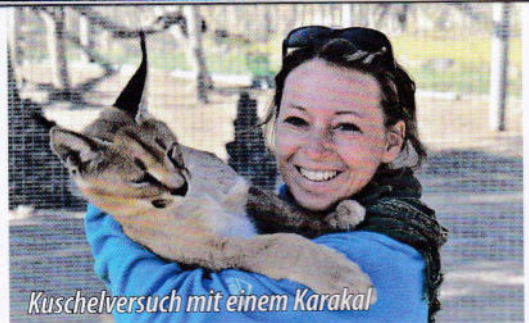
Kuschelversuch mit einem Karakal