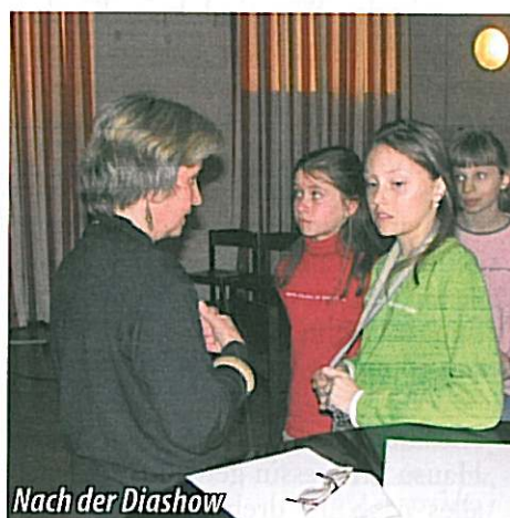
Nach der Diashow