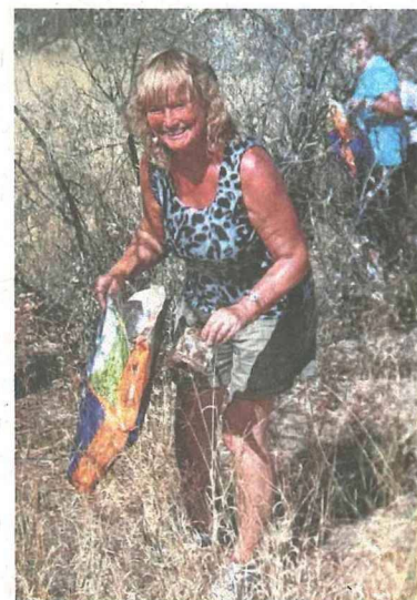
Auch beim Aufräumen in der Wüste wird kräftig angepackt.

Ohne Leine, versteht sich. „Anstrengend war die Arbeit nicht, weil sie soviel Spaß gemacht hat. Es ist