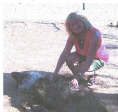
Auch eine Hyäne wurde gerne gekraut.